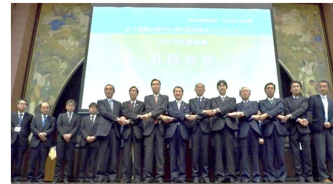
森と自然の育ちと学び 自治体ネットワーク設立総会 （H30.10.22）