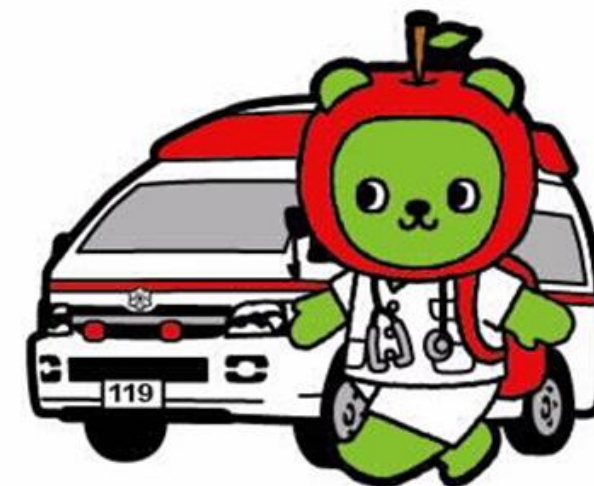
長野県PRキャラクター「アルク」©長野県アルク

安心して妊娠・出産に臨める医療環境の実現が急務であることから、産科医離れの原因となっている医療紛争などの訴訟リスクを軽減し、産科医が萎縮することなく診療できる環境の整備に向けた 産科医療補償制度の拡充 に取り組むこと