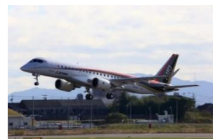
H27. 11 に初飛行が成功した MRJ

5年計画（H28～H32）、総事業費 1,455,209 千円（長野県 1,005,209 千円、南信州広域連合 450,000 千円）、ハード事業割合 9.7%