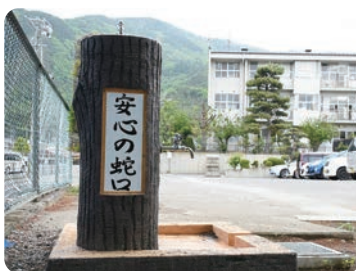
坂城小学校(坂城町坂城)

令和3年5月、坂城町立坂城小学校に、「安心の蛇口」を設置しました。 先生や地元の方が「組立式応急給水栓」を組み立て、子どもたちは給水袋に水をためる体験を行いました。