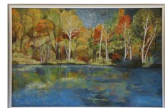
昨年の知事賞 日本画