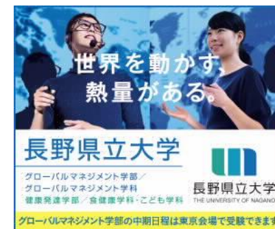
[サーチャータゲティング広告]

また、ターゲットを絞ったサーチャータゲティング広告（本学と競合する大学をWEB検索した18-21歳ユーザー（受験生）に対し、広告が表示される）や新聞系出版社が発行する進学情報誌への特集記事（朝日新聞出版・AERA）の掲載など、知名度向上のための取組を行った。