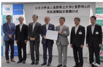
[包括連携協定（長野市）]