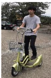
[ウォーキングバイシクル]