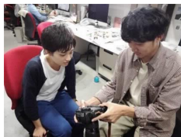
[インターンシップの様子]

平成30年度については、学生がまちなみカントリープレス (出版社) のインターンシップに参加し、主体的に就業体験を積み重ねる機会を持った。