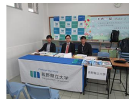
[日本大学連合学力試験面接（香港）]