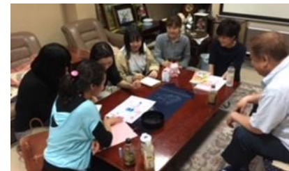
[三輪地区商店街夏祭りポスター作成]

平成30年度の取組状況は、寮生242人のうち141人（58.3%）が参加し、123人の学生から活動の報告があった。