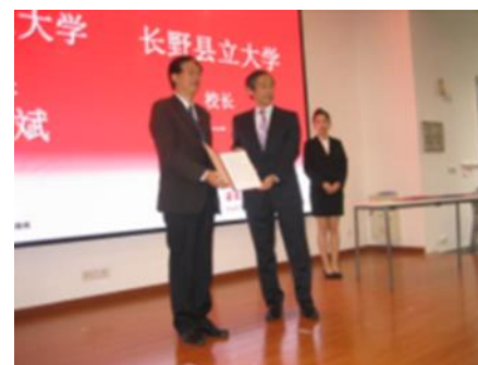
[華東師範大学との協定締結]

海外大学との交流の促進に向けた取組として、10月に中国・上海において華東師範大学との学術交流協定を締結した。