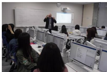
[CALL教室での授業の様子]

1年次と2年次の必修科目として英語集中プログラムを実施した。CALLシステム（コンピュータを活用した外国語学習）も利用しながら、正確な英語運用能力を高める科目と英語コミュニケーション能力を高める科目の両方を履修することにより、バランスよく実践的な英語力を養成し、また、「読む・聞く・書く・話す」の4技能融合型の授業によって、4技能を有機的に使いこなす力を身に付けている。