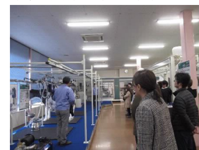
[GM学科による企業訪問の様子]

県内企業等との連携を通じて学生の学修機会を充実させることにより、プログラム後の学修成果の共有や、本学の産学連携促進に寄与することが期待できる。