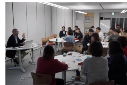
【象山未来塾の様子】

寮での学習サポートの一環として、キャリアセンター主催の「象山未来塾」を計7回開催し、延べ129人が参加した。象山未来塾は、教員や企業、地域住民をゲストに寮生と語り合い、イノベーションの思想に触れることで、自分のキャリアを考えるための教育課程外プロジェクトとして位置付けている。参加者の満足度は100%（終了後のアンケートより）と高い学習効果を上げることが出来た。