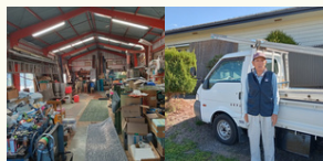
山岸板金工業所 山岸 今朝登氏 (筑北村)