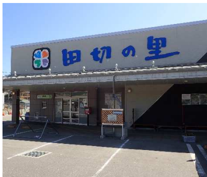
写真1 道の駅 田切の里