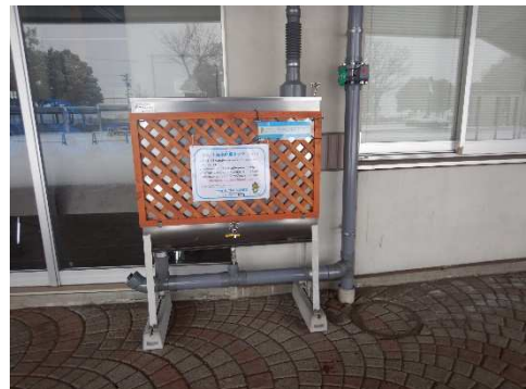
写真2 上田県営球場