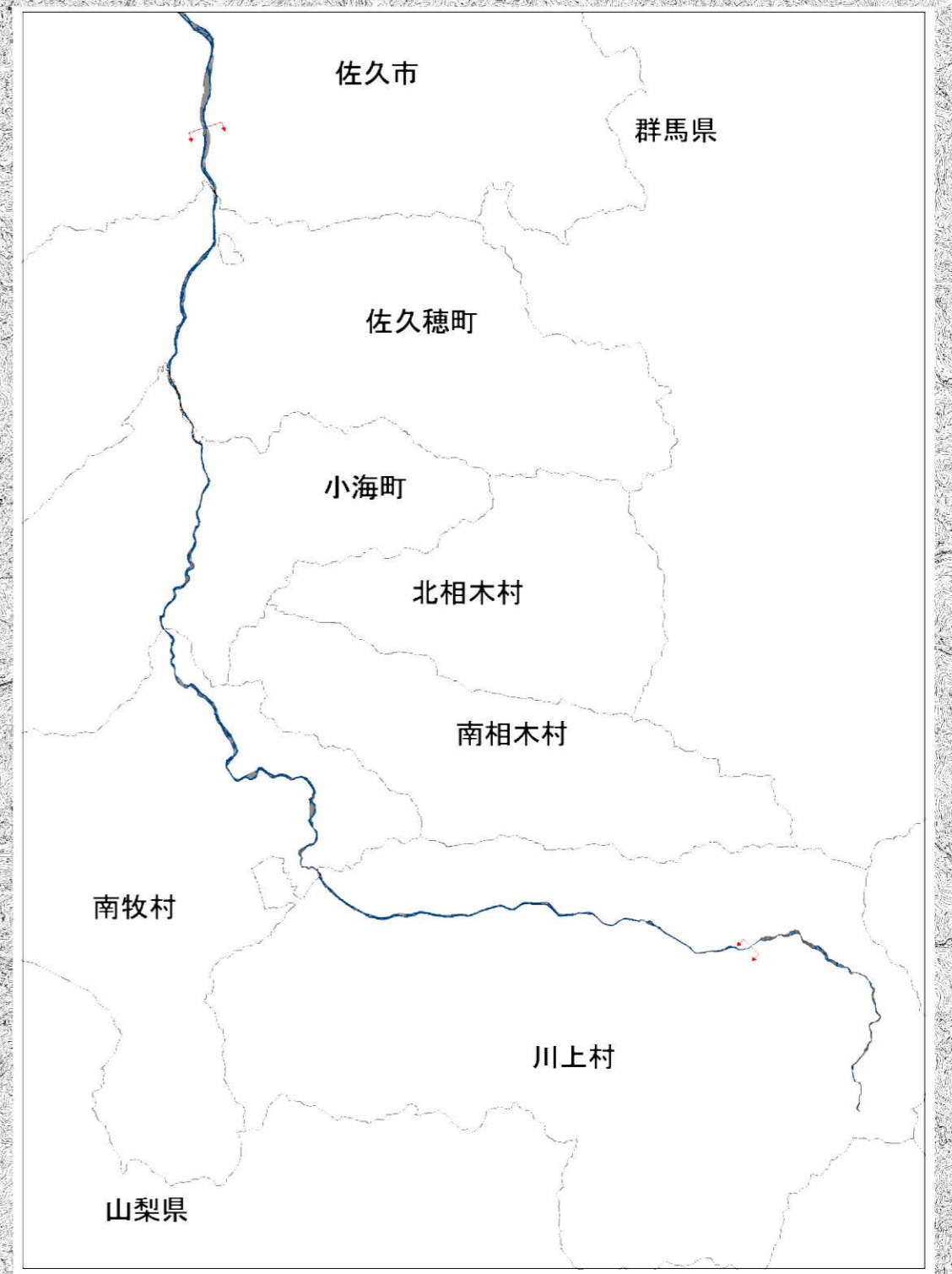
信濃川水系千曲川 洪水浸水想定区域図 (想定最大規模降雨)