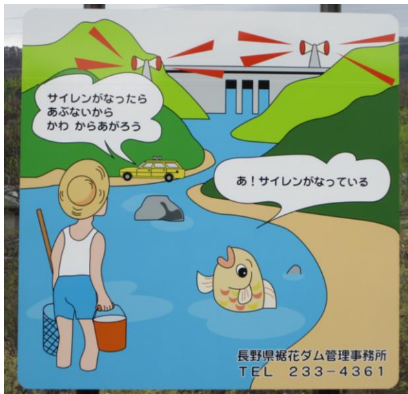
周知立札（絵図）の一例