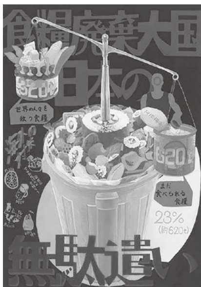
長野県松本県ヶ丘高等学校 2年