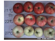
着色期の高温による影響