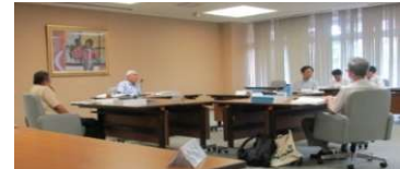
環境影響評価技術委員会（水象部会）

環境保全への適正な配慮の推進のため、リニア中央新幹線に係る環境調査並びにトンネル工事及び発生土置き場における環境保全等について、県環境影響評価技術委員会、関係市町村、地元住民等の意見をもとに、環境保全のための助言を通知する。