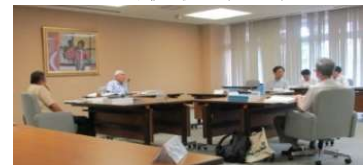
環境影響評価技術委員会（水象部会）