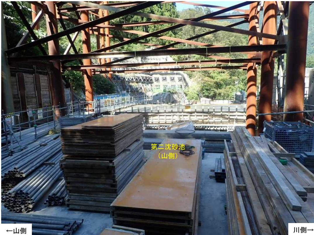
第二沈砂池(山側) 施工状況(上流より)