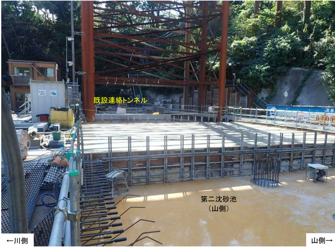
第二沈砂池(山側) 施工状況(下流より)