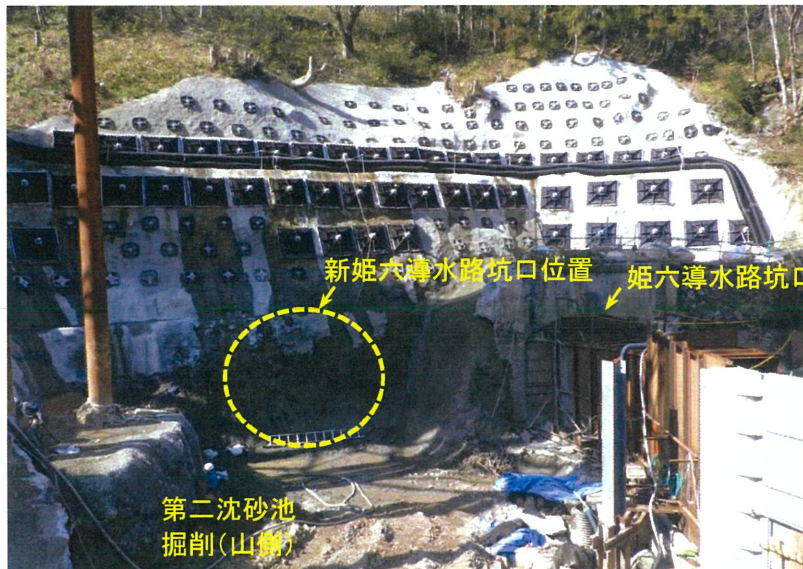
導水路坑口掘削及び 上部法面補強状況(上流より) (2020.03.30撮影)