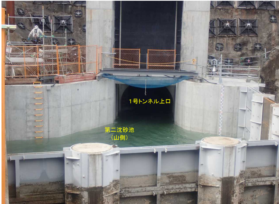
第二沈砂池(山側) 施工状況(上流より)