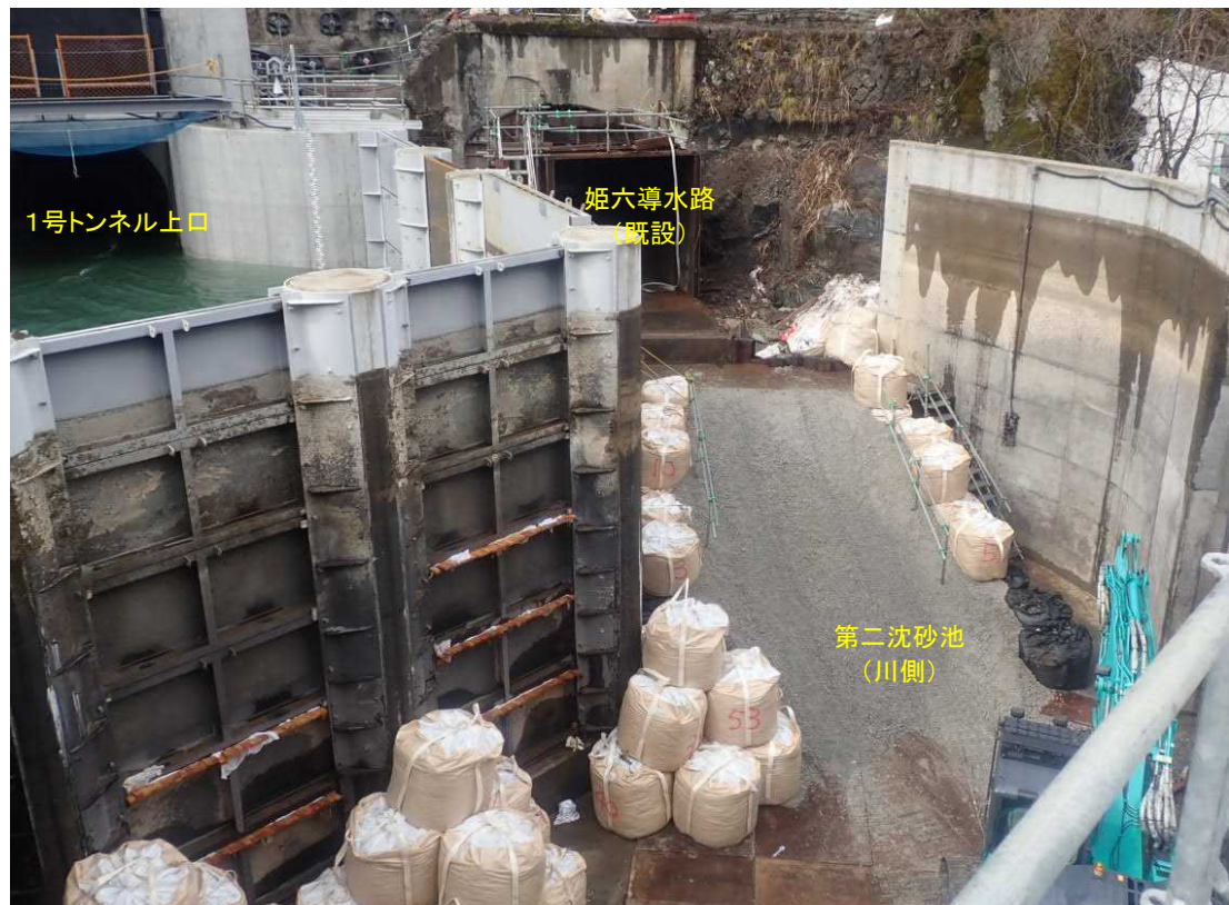
第二沈砂池(川側) 施工状況(上流より)