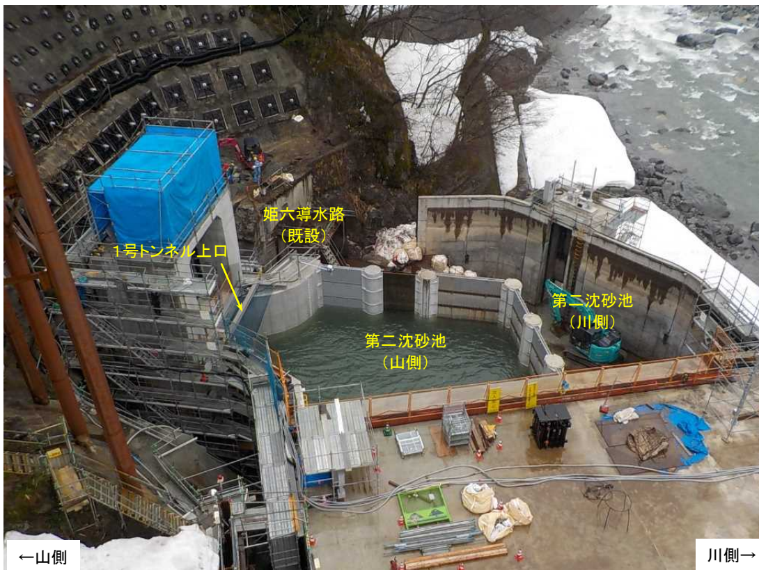
第二沈砂池(山側) 施工状況(上流より)