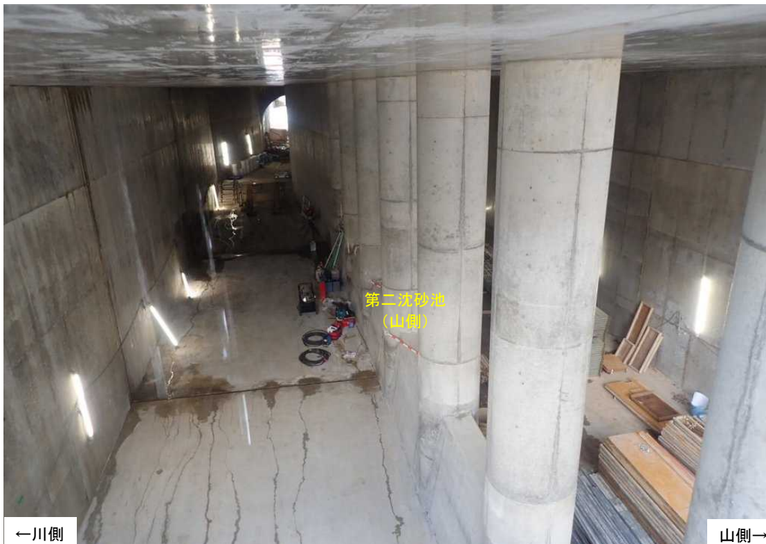
第二沈砂池(山側) 施工状況(下流より)