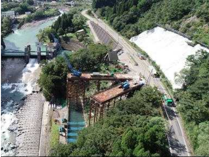
全景（下流側より） （H30. 9. 26撮影）