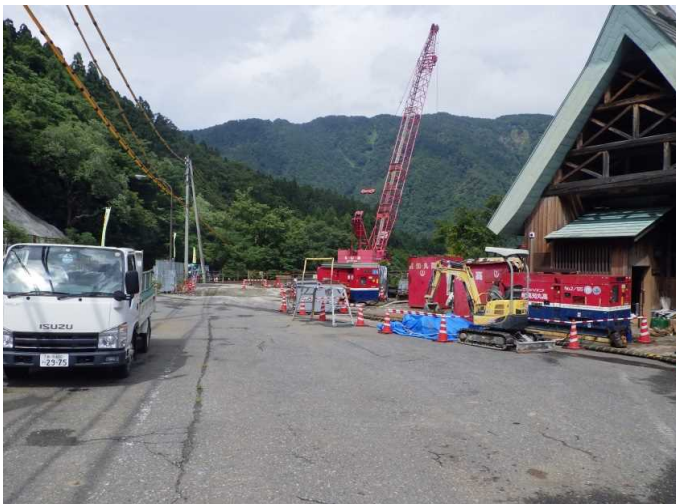
工事ヤード （H30. 8. 28撮影）