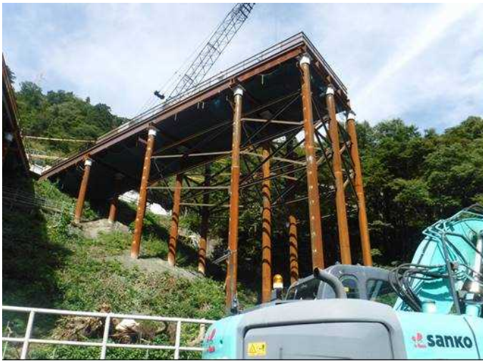
作業構台 （H30. 9. 26撮影）