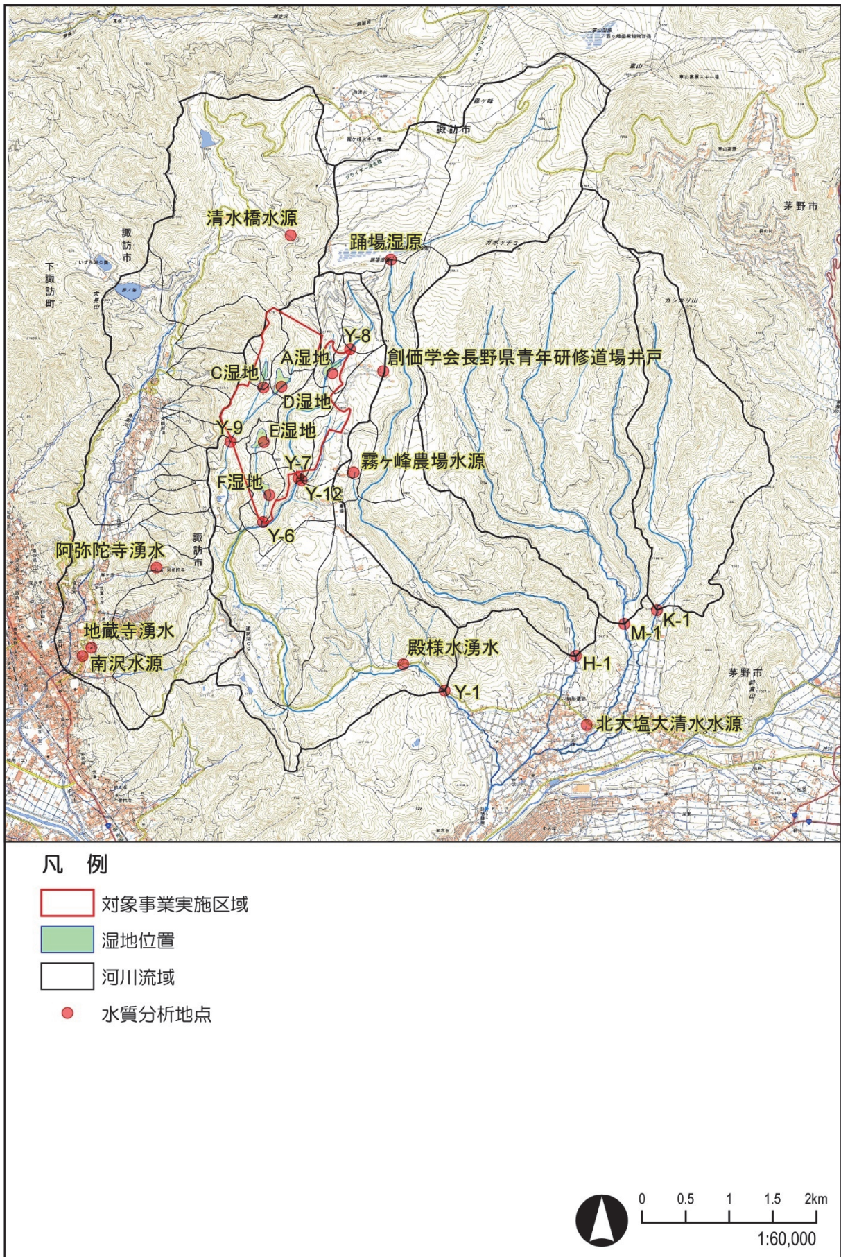
图 4-6-6 水質分析位置图