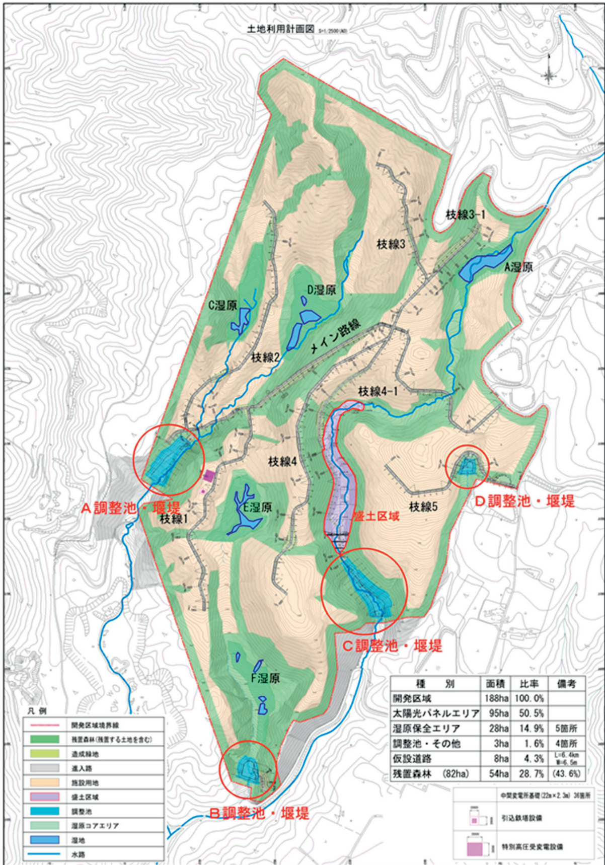
図 1-6-3 土地利用計画 (方法書段階)