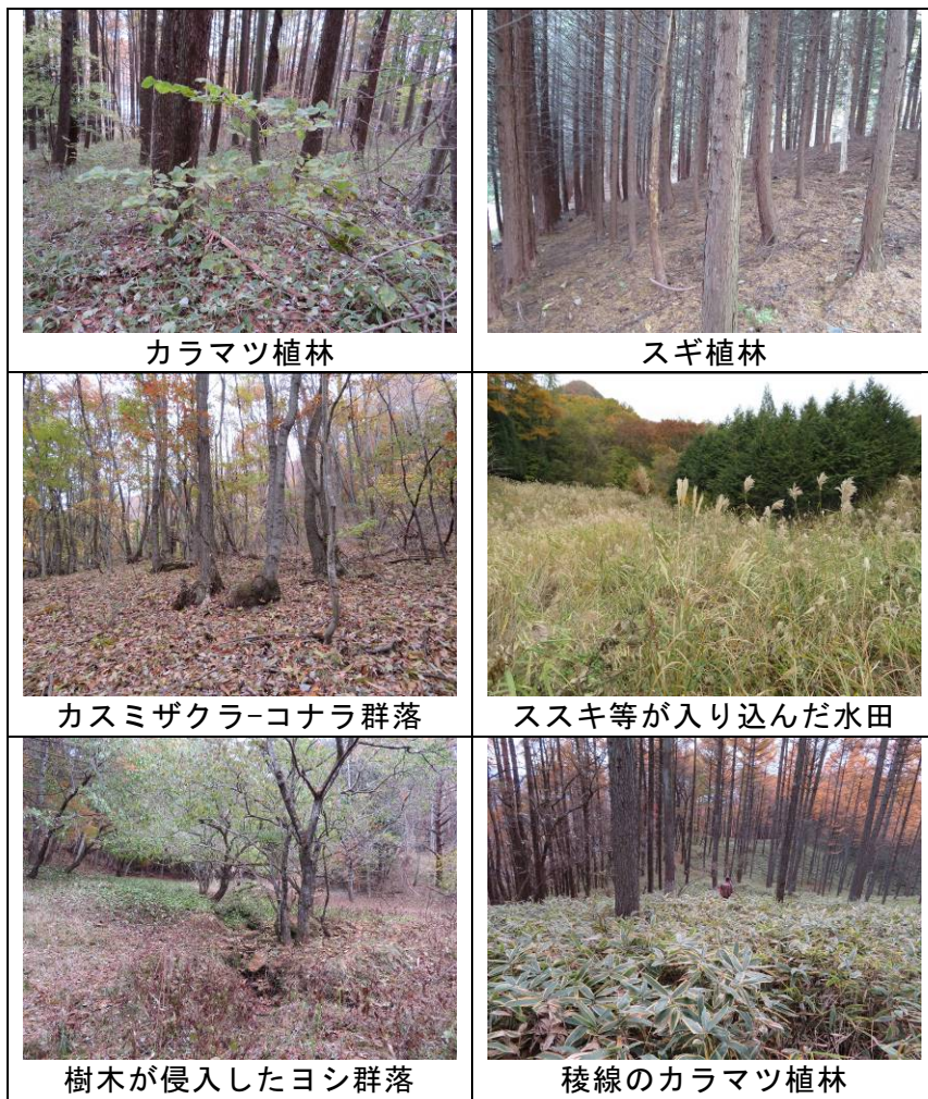
写真2.3-1 植物群落の現在の状況（平成28年11月撮影）