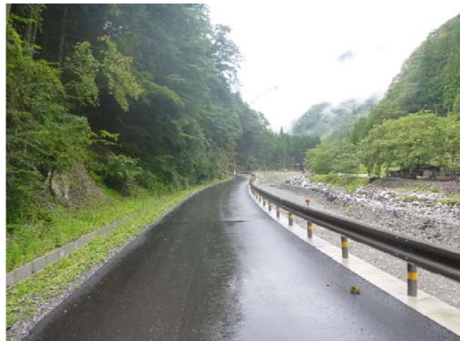
工事用道路の仮舗装