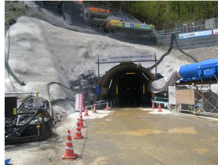
トンネル坑口 防音扉の設置