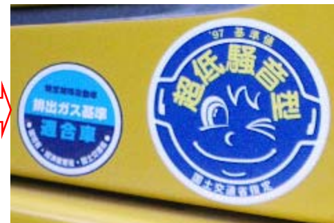
排ガス対策型・低騒音型建設機械