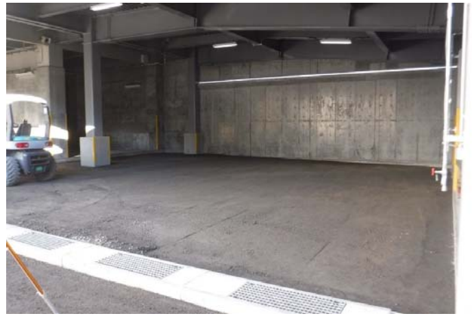
■外構路盤工事状況