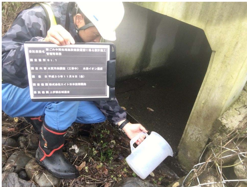
口水質測定状況（採水状況）