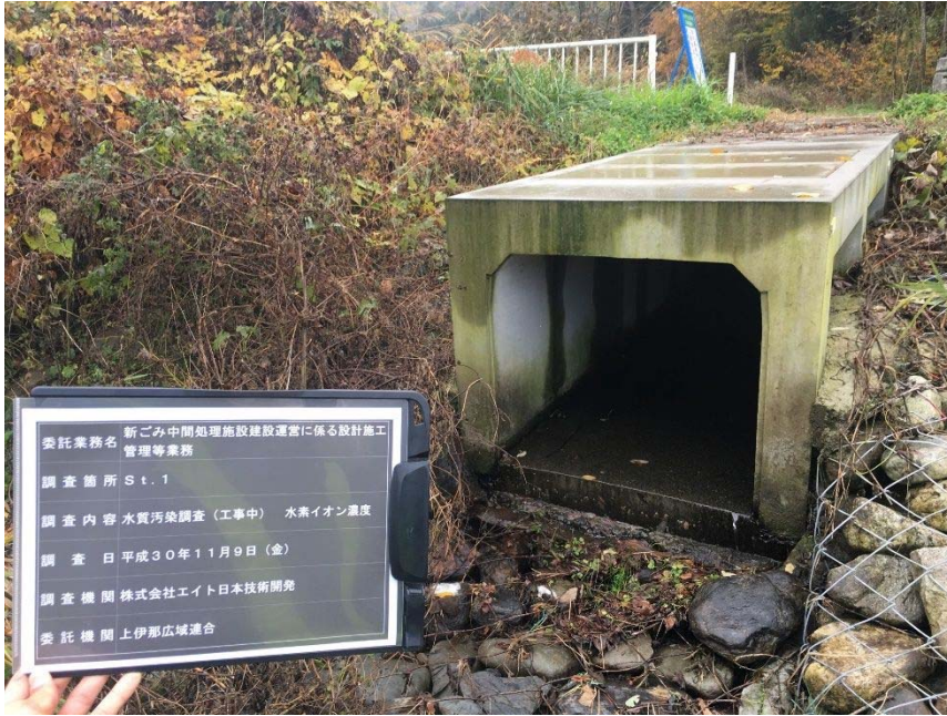
口水質測定状況（測定地点）