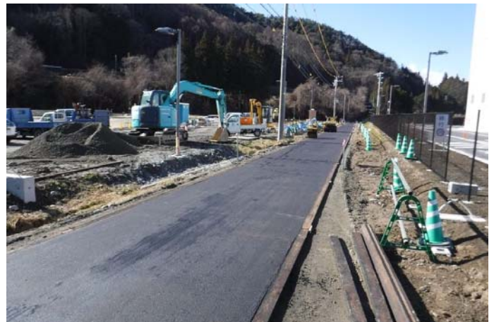
■市道舗装完了状況