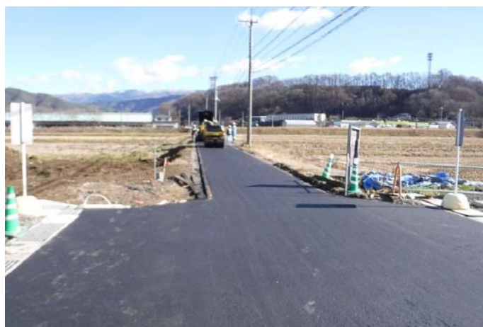
■市道舗装工事状況