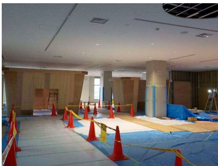
プラント工事(情報発信設備)