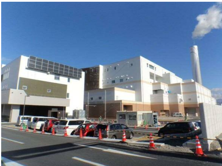
(工場棟・管理棟:南西側外観)