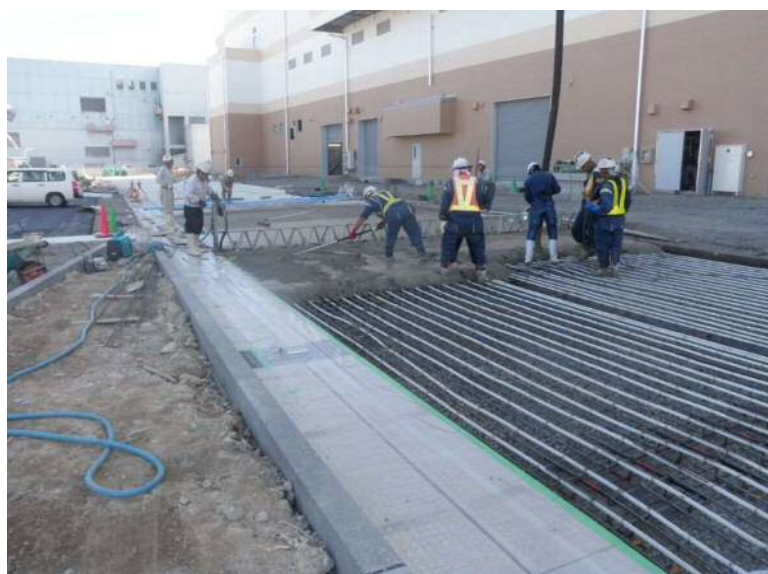
外構工事(コンクリート舗装)