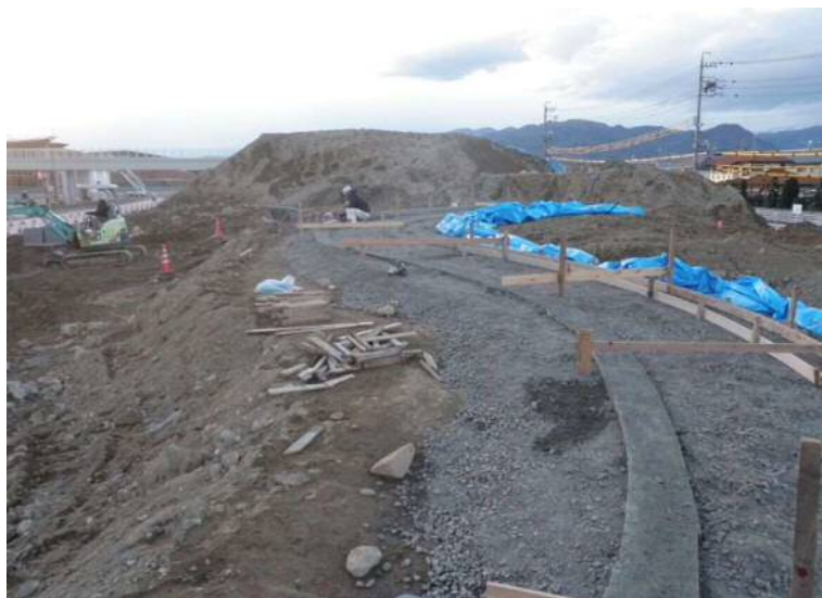
外構工事(遊歩道縁石)