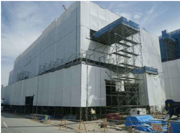
管理棟等工事(管理棟)