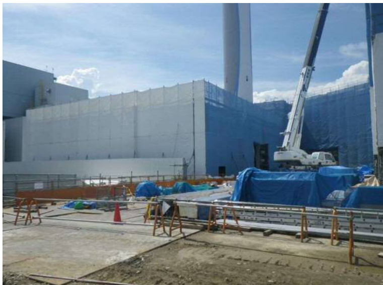
管理棟等工事(スラグストックヤード棟)