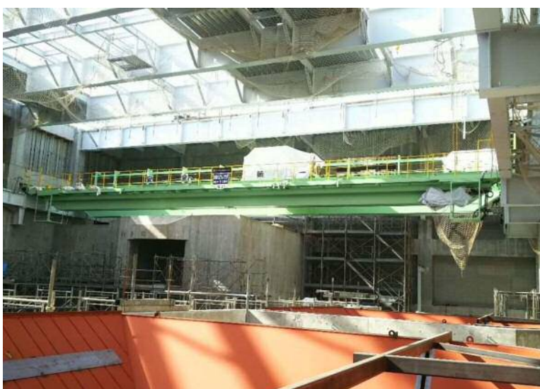
プラント工事(機器取込)