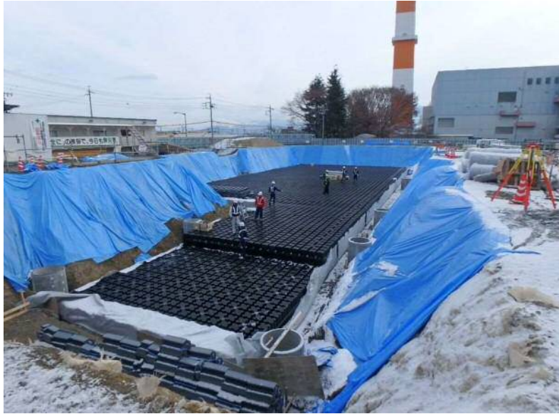
外構工事(雨水排水施設)