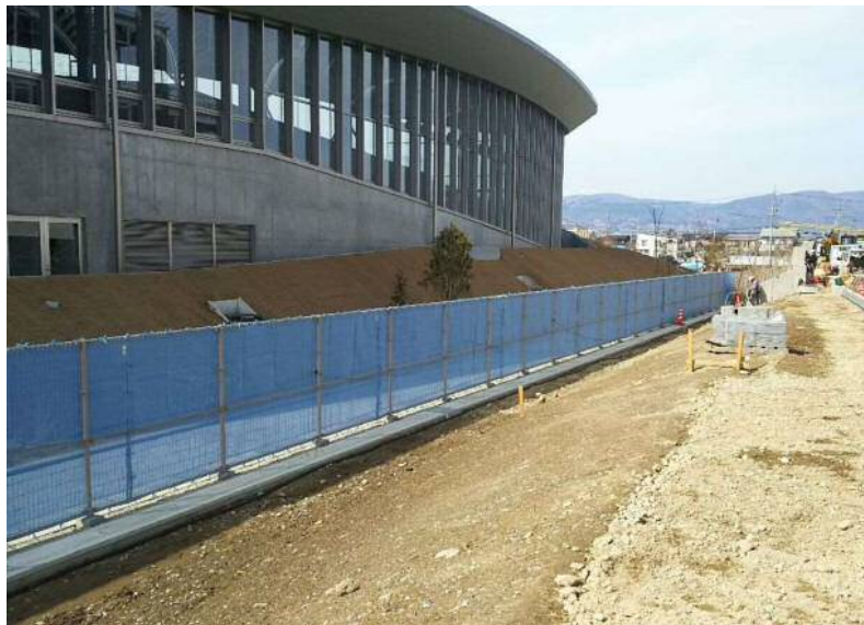
外構工事(擁壁・フェンス)