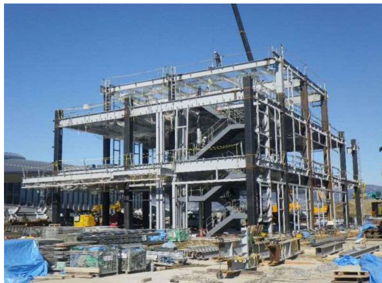
管理棟等工事(管理棟)