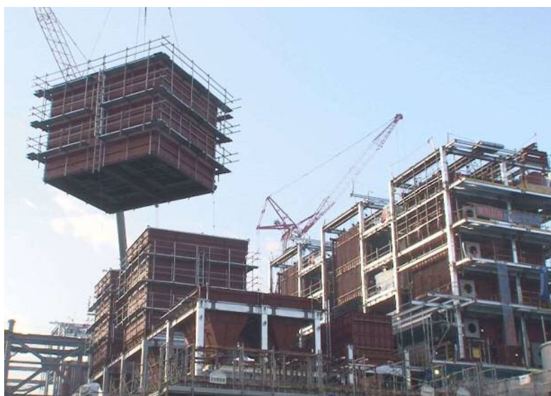
プラント工事(機器取込)