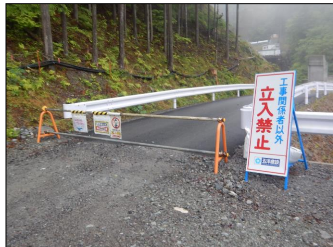
工事現場への立ち入り禁止柵