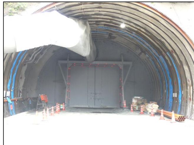
トンネル坑口 防音扉の設置