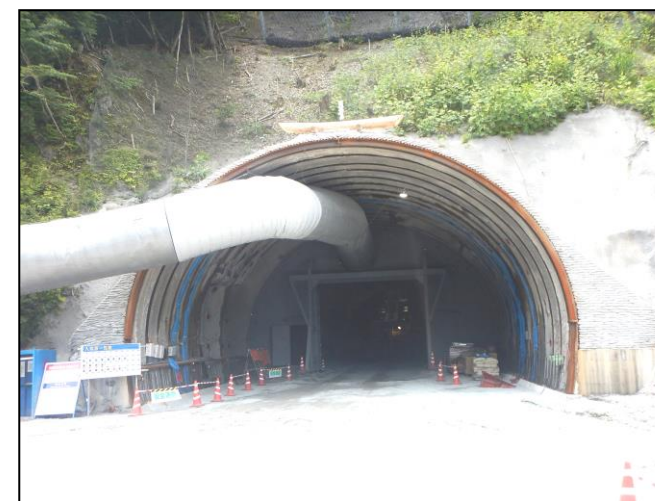
②トンネル本坑坑口