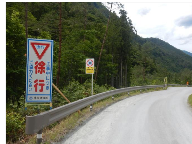
規制速度・走行速度の明示