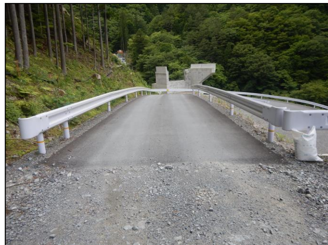
工事用道路の仮舗装