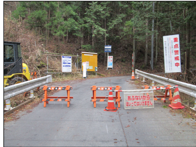
工事現場への立ち入り禁止柵