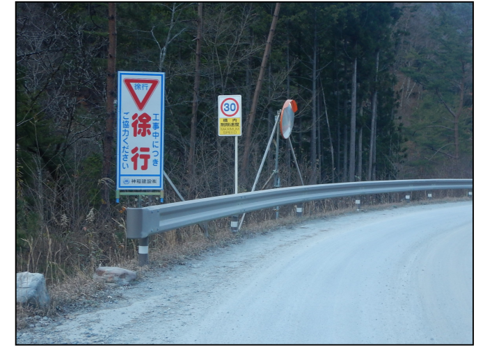
規制速度・走行速度の明示