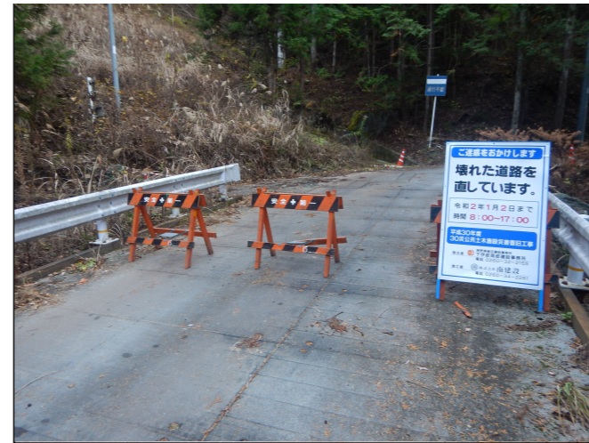
工事現場への立ち入り禁止柵