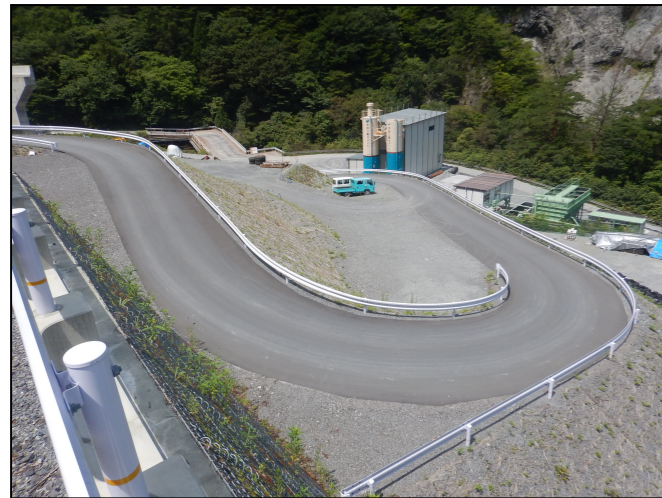
工所用道路の仮舗装