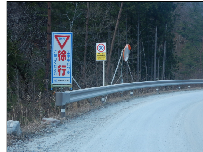
規制速度・走行速度の明示