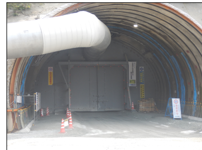
トンネル坑口 防音扉の設置