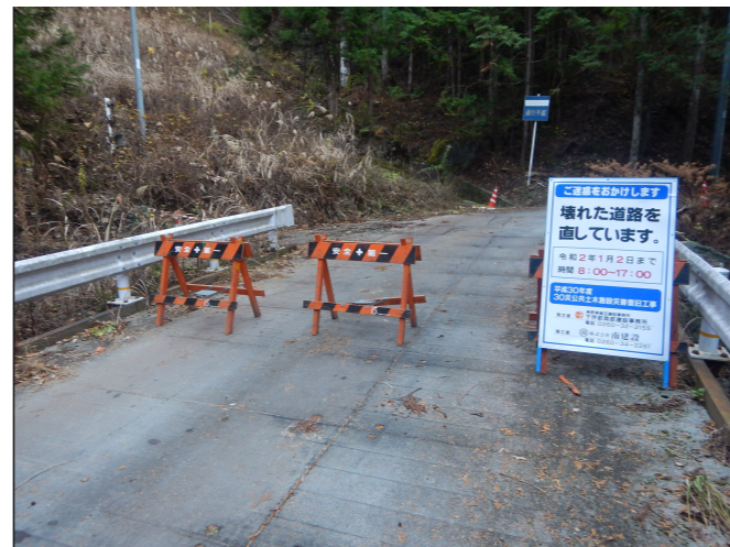
工事現場への立ち入り禁止柵