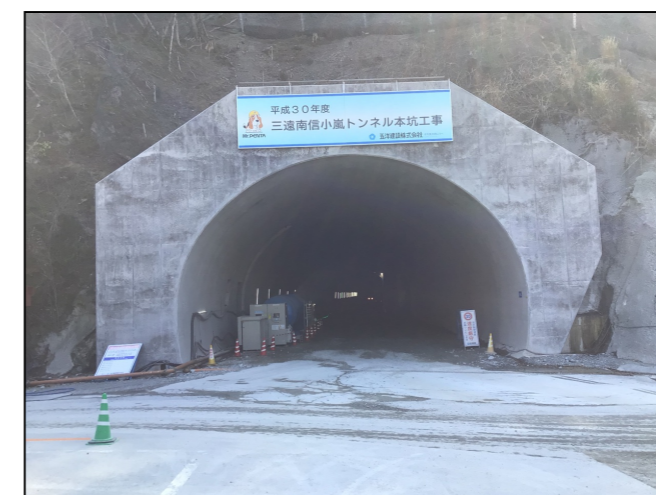
②トンネル本坑坑口