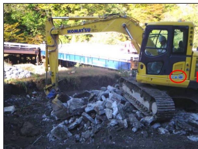
排ガス対策型・低騒音型建設機械