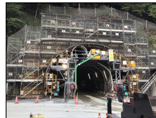
③トンネル本坑坑口