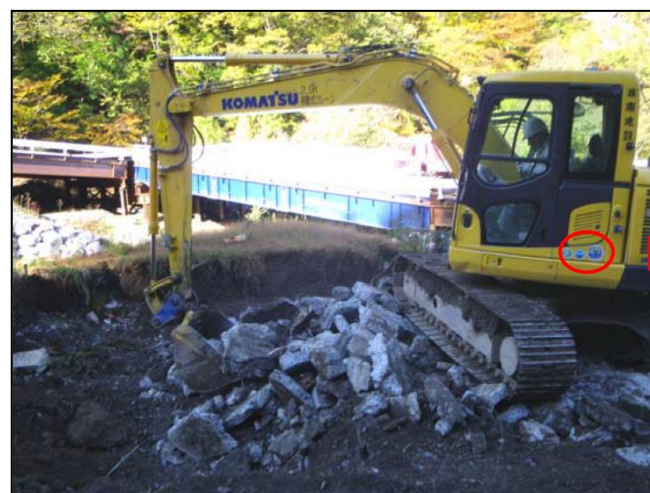
排ガス対策型・低騒音型建設機械