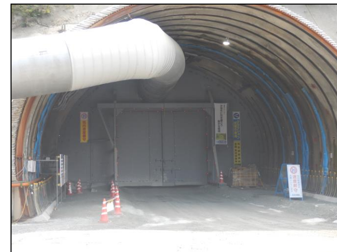
トンネル坑口 防音扉の設置