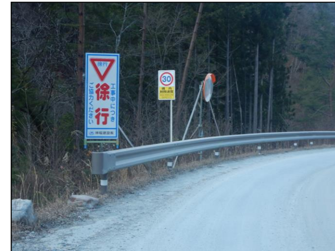
規制速度・走行速度の明示