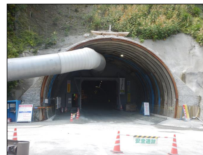
②トンネル本坑坑口