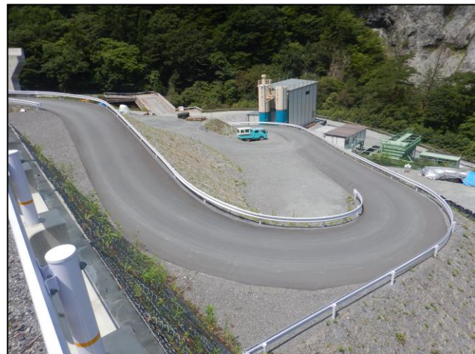
工所用道路の仮舗装