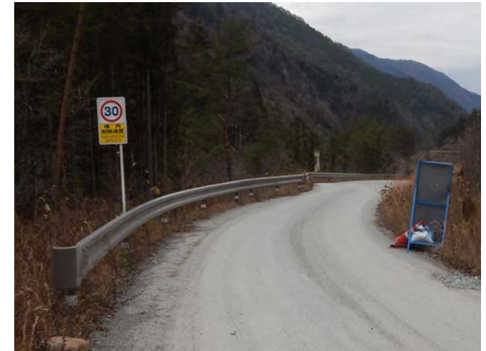
規制速度・走行速度の明示