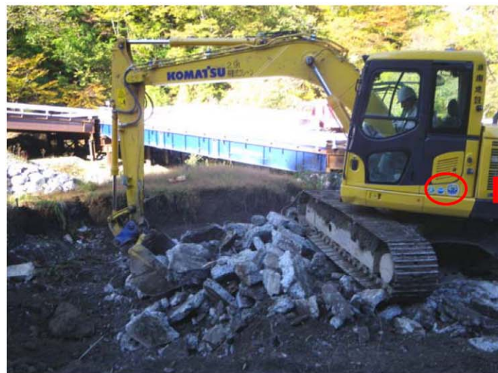
排ガス対策型・低騒音型建設機械