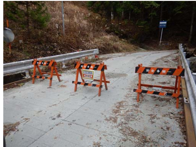
工事現場への立ち入り禁止柵