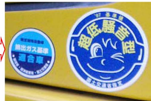
写真 保全対策実施状況