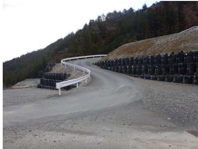
工所用道路の仮舗装