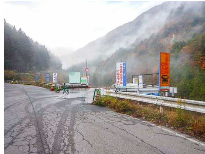
工事現場への立ち入り禁止柵