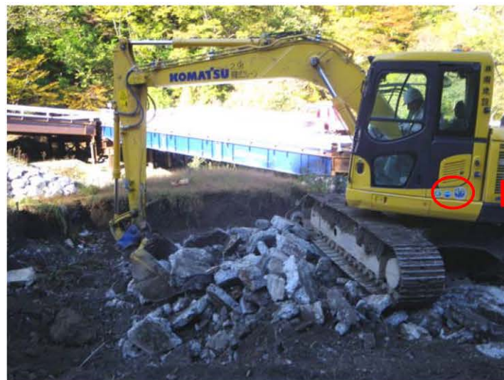
排ガス対策型・低騒音型建設機械