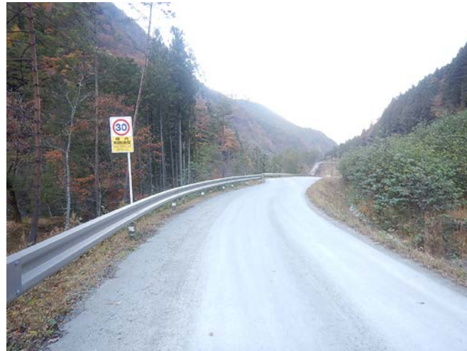
工事用道路の仮舗装