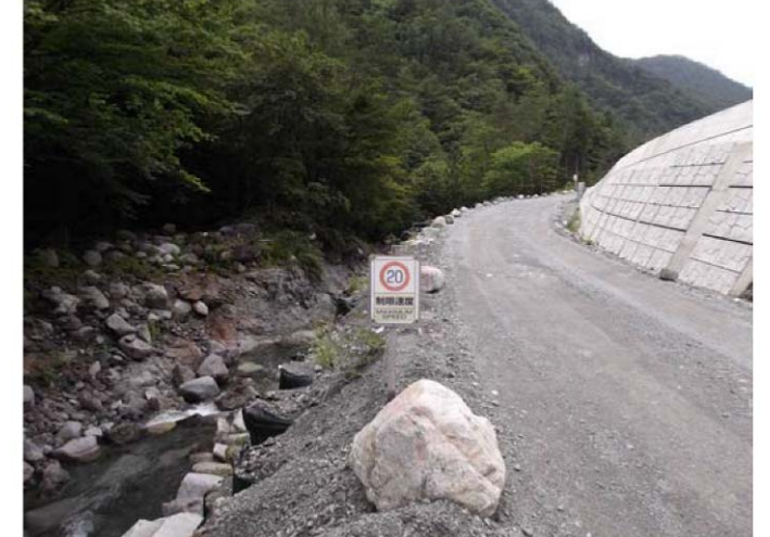
規制速度・走行速度の明示