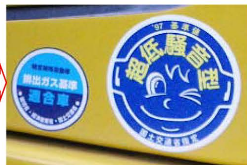
排ガス対策型・低騒音型建設機械