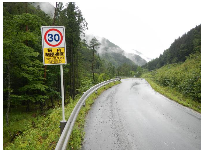
工所用道路の仮舗装