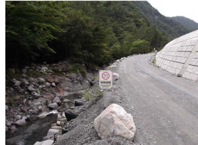
規制速度・走行速度の明示