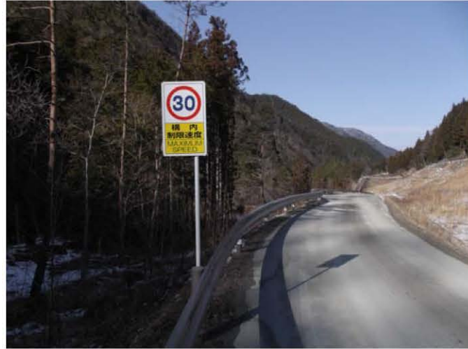
工事用道路の仮舗装