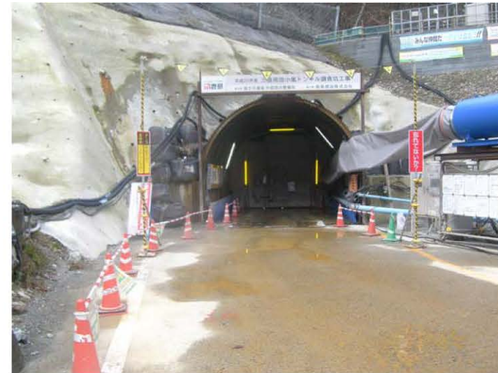
トンネル坑口 防音扉の設置