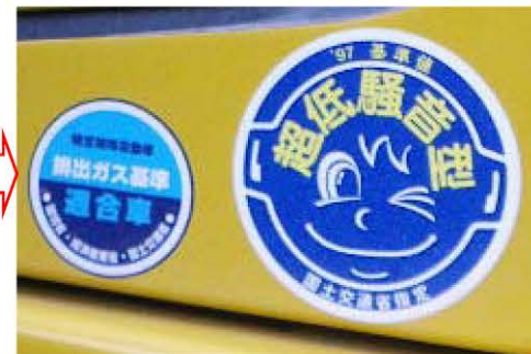
排ガス対策型・低騒音型建設機械