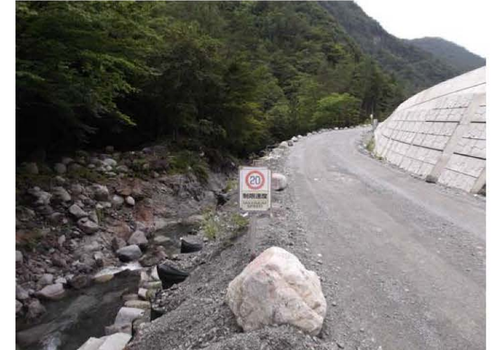
規制速度・走行速度の明示