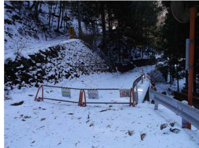
工事現場への立ち入り禁止柵