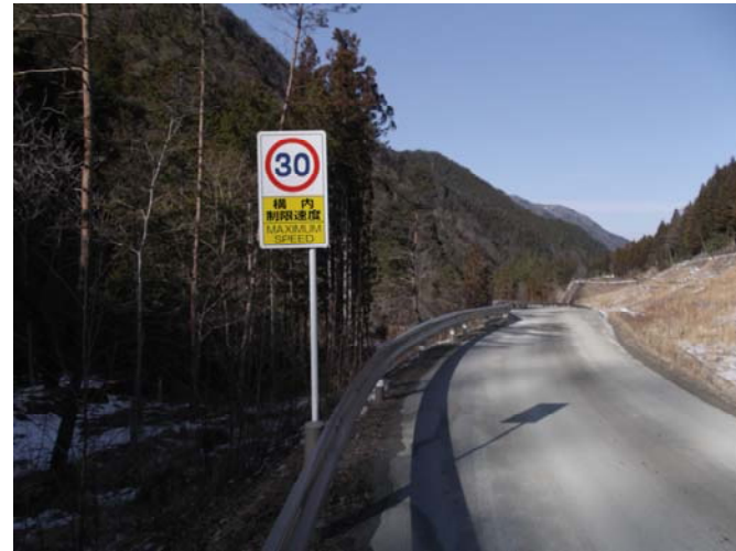
工事用道路の仮舗装