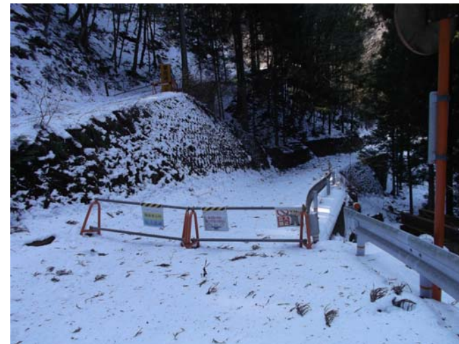
工事現場への立ち入り禁止柵