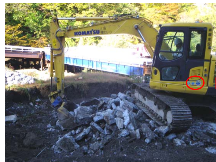
排ガス対策型・低騒音型建設機械