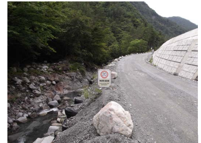
規制速度・走行速度の明示