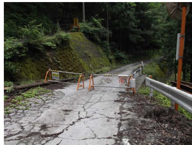
工事現場への立ち入り禁止柵