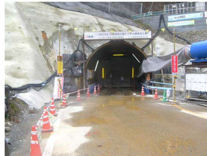
トンネル坑口 防音扉の設置