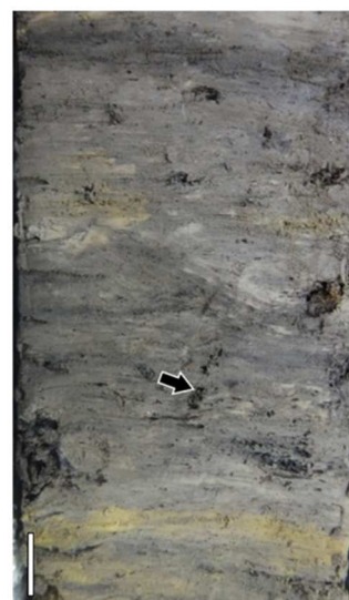
図2 諏訪湖堆積物コアの泥質堆積物に含まれる根化石（矢印の先）。スケールバーは1 cmを示す。

成果： 両コアにおいて、更新世の最終氷期末（約1万6000年前）～完新世中期（約6000年前）に相当する層準には、泥質堆積物が連続的に堆積しており、湖環境が広がっていたことが明らかになりました。この泥質堆積物の化学分析によると、数百~数千年間隔でSiO 2 量の低下が認められ（図3A）、珪質な殻をもつ珪藻が頻繁に減少していたことが示されました。珪藻の減少する層準には、古土壌の痕跡（根化石など）が認められ（図2、図3Aの赤矢印）、コアの掘削地点が地表に露出し、長期間空気に曝されていたことがわかりました。これらの結果から、諏訪湖の水位の一時的な低下により干上がったコアの掘削地点では古土壌が形成され、珪藻の堆積が停止したと考えられました。水位の低下は、両コアで共通して4回（約1万2000年前、約8000年前、約7900年前、約7000年前）認められました（図3の黄色の背景部分）。約1万2000年前と約7000~8000年前は、世界的に寒冷だった時期（ヤンガードリアス期 (注3) 、約8200年前の寒冷化イベント）に概ね一致します。これらの時代は、東アジアにおいては、夏季モンスーンが弱まった乾燥期であったとされます（図3Cの薄緑色の領域）。以上のことから、東アジアの乾燥化により、諏訪湖周辺では降水量（流入量）が減少し、湖の水位が低下したと考えられます。この結果は、世界的な百~千年スケールの気候変動に駆動された東アジアの気候変動が、中部日本の内陸湖の水位に影響を及ぼした可能性を示します。