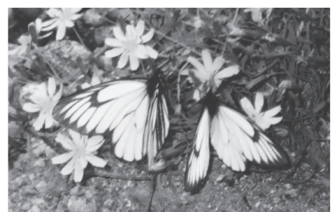
ミヤマシロチョウ