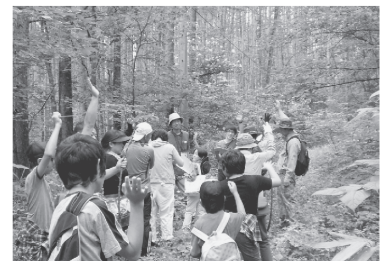
「飯綱高原の植物とチョウ」 森の中でクイズに挑戦！