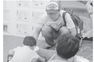
「川の水生生物を観察しよう」 すごい、こんなにいるの！

飯綱庁舎では、「けんきゅうじょ たんけん」、「森のエコくいずツアー」、葉っぱのすかし絵等の「ワークショップ」を行いました。