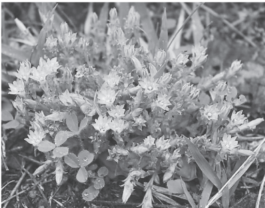
図1 花盛りのコケリンドウ

長野県でのコケリンドウの記録は、『長野県植物誌』で引用された軽井沢町、松本市、木曾福島町で採集された標本のほかに、『長野県植物誌資料集CD-ROM』に朝日村、望月町(現佐久市)、茅野市で採集記録があります。それらの記録はすべて1928年以前のもので、長野県版レッドリスト作成時には、それ以後の標本記録がなかったことから、同リストにおいて絶滅種とされていました。また、長野県の近隣県では、山梨県で広く分布しますが、群馬県、