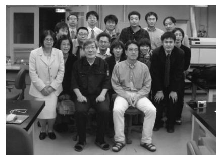
研修終了後、先生を囲んで