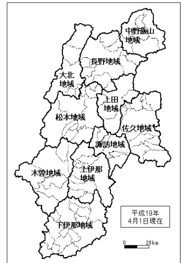
新しい発令対象地域区分図