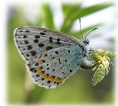
産卵中のオオルリシジミ