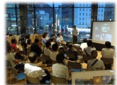
サイエンスカフェ風景