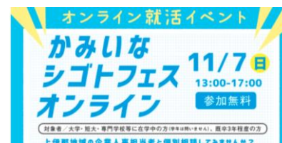
【各種イベントのチラシ】