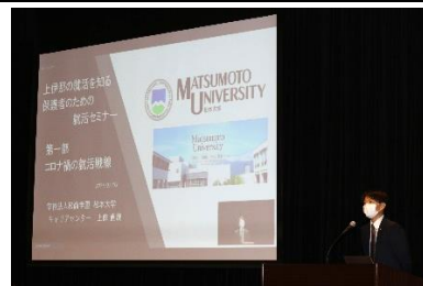
【保護者向け就活セミナーの様子】

今年度の事業の中で、地元企業・団体の人事担当者や若手職員などとの対話や質疑応答を通じて上伊那地域を知ってもらうことができた。しかし、アンケート結果から対話だけではなく、現地で実際に働く様子や現場の様子を見たいという声が多くあったため、来年度は企業見学会を実施する。併せて、保護者向け就活セミナーをきっかけとして、各企業の選考が始まるまでの間、上伊那で一連の就活イベントを行うことで、一度参加してくれた学生を離さずに各企業の選考まで繋ぎとめていき、上伊那地域の人材を確保したい。