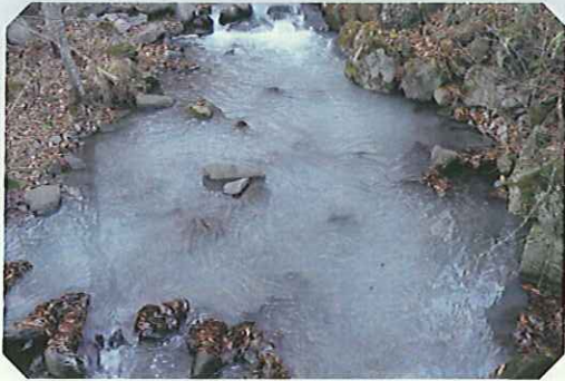
重油流出事故の様子

油や農薬などが河川へ流出してしまったり、水質の異常によって魚が死んでしまったりする「水質汚濁事故」が多発しています。