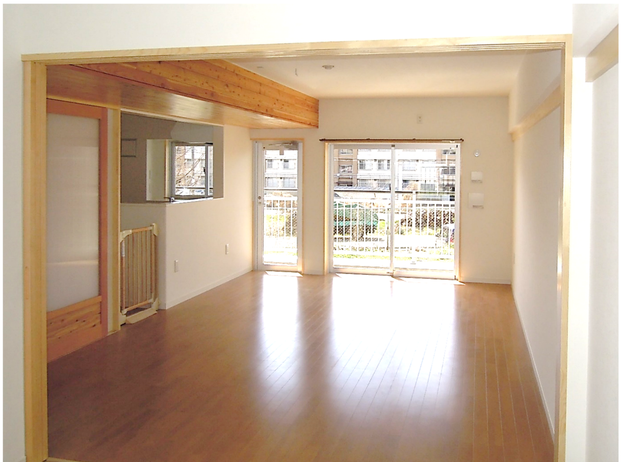
家族団らんの広いリビングダイニング