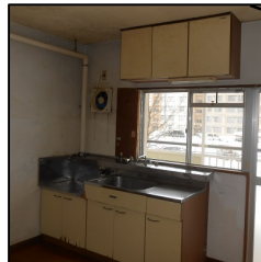
老朽化した台所 子どもの状況が分からない