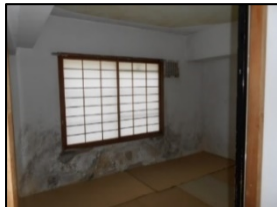
断熱材なし 結露による壁のカビ