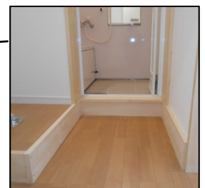
洗濯機置場 ユニットバス設置