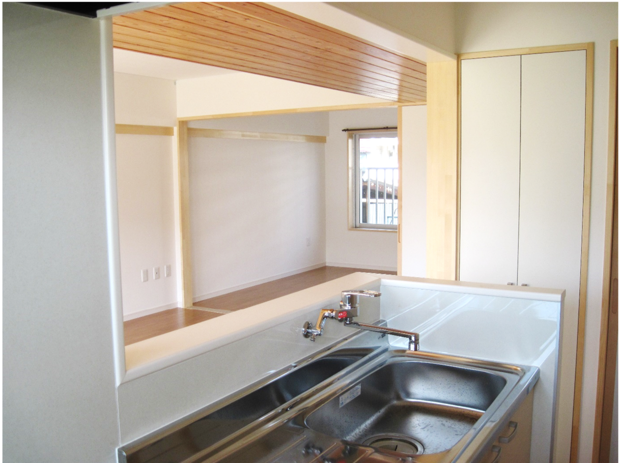
子どもを見守りながら家事が出来る対面キッチン