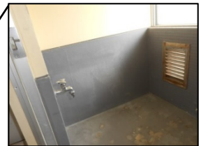
入居設備なし（入居者設置）