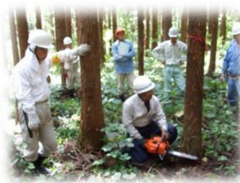
地域主体の里山整備