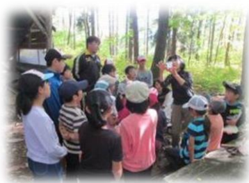
森林環境教育・自然保育