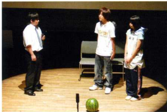
梓川高校生の寸劇「いつものニュース」

開会に先立ち、波田少年少女合唱団による合唱が行われ、美しい歌声で会場の雰囲気盛り上げました。