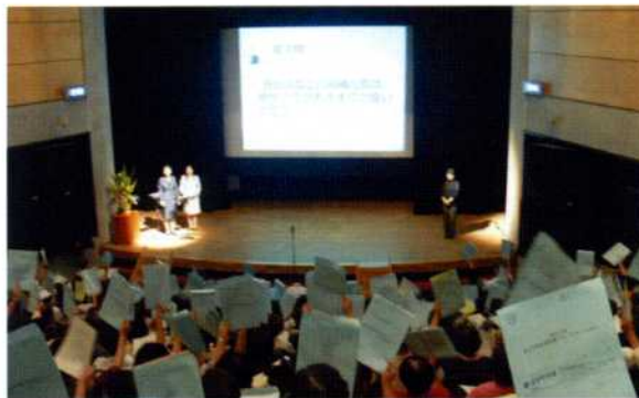
参加者による意識チェック

このほか、長野県男女共同参画推進県民会議の構成団体などによる日頃の活動成果の展示・販売も行われ、訪れた方からは楽しく勉強になるイベントだった、といった感想が聞かれました。