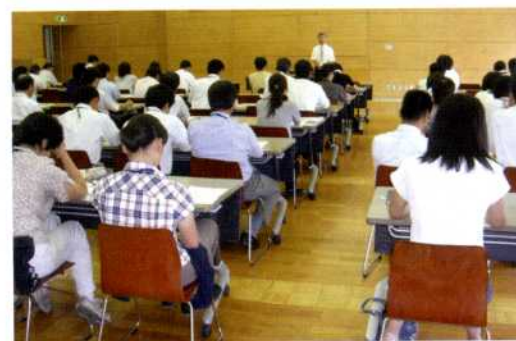
伊那市職員研修会

( http://www.pref.nagano.jp/soumu/koho/demae/kagami.htm )