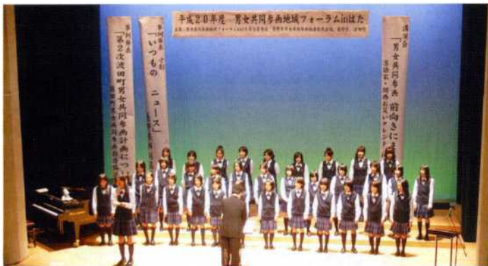
波田少年少女合唱団による合唱