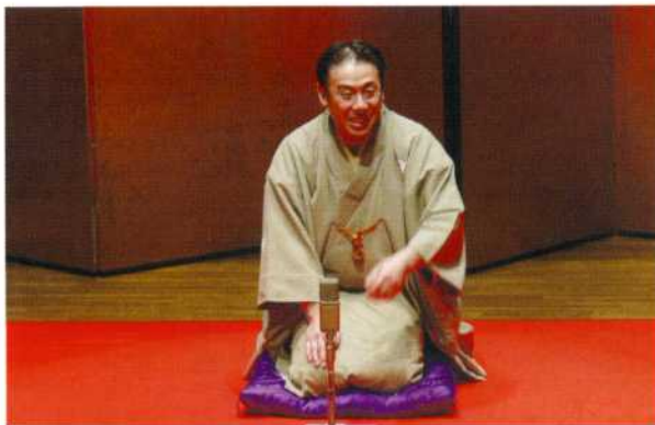
林家花丸さん「男女共同参画 前向きにまろく考える」